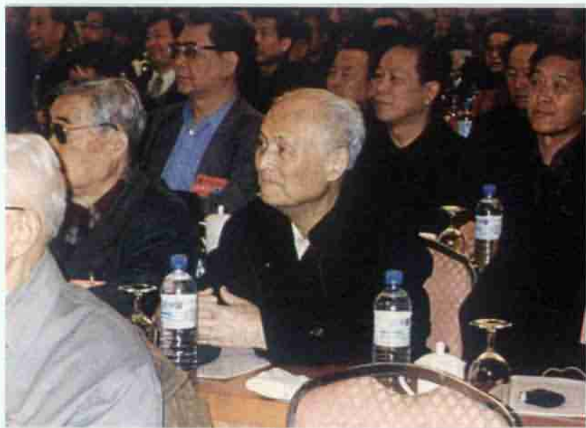
■ 李銳在“十六大”會議期間