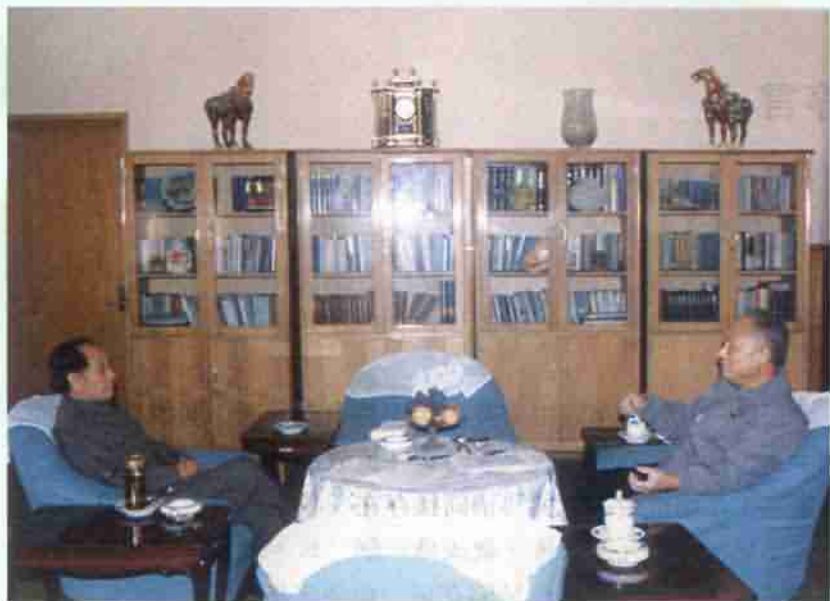
■ 1989年4月5日胡耀邦在家中與李銳長談